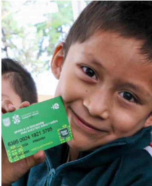
“Otorgamos becas escolares para niñas y niños en condiciones de vulnerabilidad para un casi 24 mil niñas y niños de seis a 14 años.”

Orientamos acciones para elevar la calidad educativa en todos los niveles de educación básica y media superior, con énfasis en los estudiantes de localidades con alto nivel de marginación. La Ciudad de México es la cuarta entidad federativa con mayor desigualdad en materia educativa. Estamos trabajando para cerrar esas brechas: