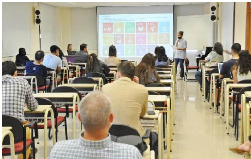
Foto: Capacitación sobre Agenda 2030 y ODS, para estudiantes y docentes de la Universidad Adventista del Plata. Libertador General San Martín. Entre Ríos