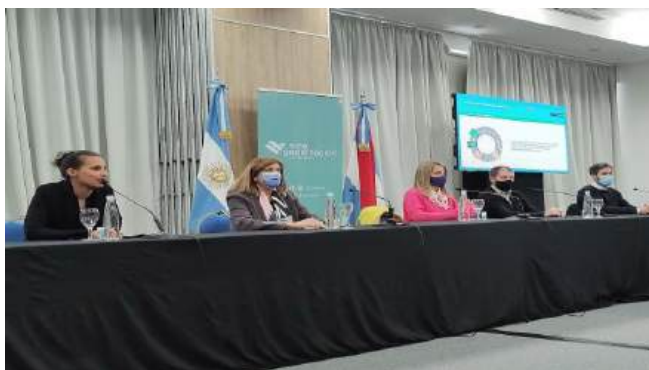
Foto: reunión de presentación de los ODS en la provincia. En la imagen, la Vicegovernadora de la provincia, acompañada por los ministros de Economía, de Gobierno, del Consejo General de Educación y de la Secretaria de Modernización de Entre Ríos.

Articulación Interinstitucional: se generan acciones de coordinación con universidades, organismos públicos y organizaciones de la sociedad civil, destinadas a la sensibilización y ejecución de los ODS en territorio.