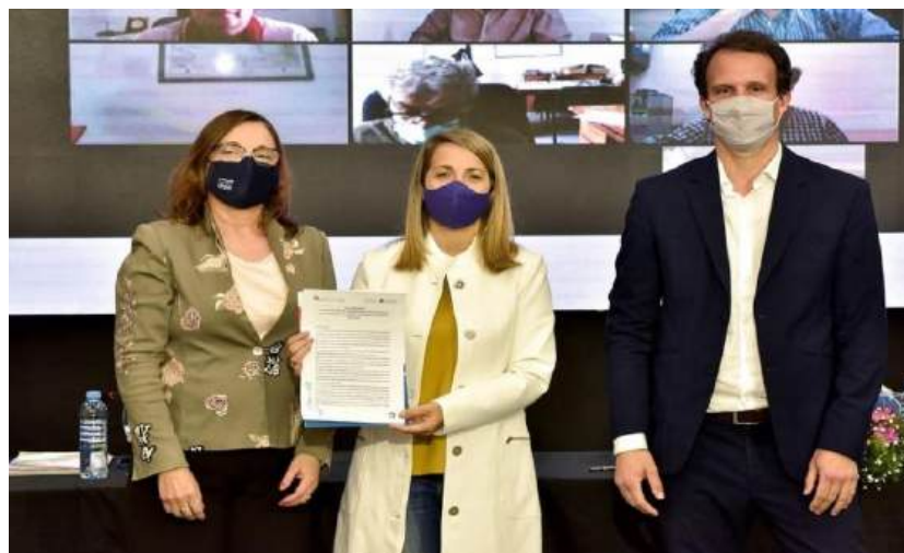
Foto: Firma del Convenio de trabajo entre la Vicegobernación de la Provincia de Entre Ríos (punto focal) con la Universidad Nacional de Entre Ríos.