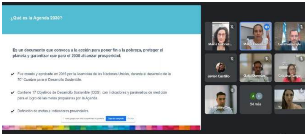
Foto: Reunión de trabajo (vía remota) con referentes de la Agencia Tributaria de Entre Ríos (ATER) sobre Agenda 2030