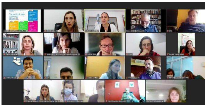
Foto: II Encuentro de capacitación para Municipios en Agenda 2030. Octubre 2021