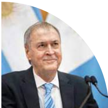
Gobernador Cr. Juan Schiaretti