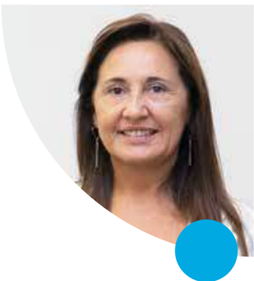
Ministra de Coordinación Cra. Silvina Rivero Punto Focal de ODS Ministerio de Coordinación