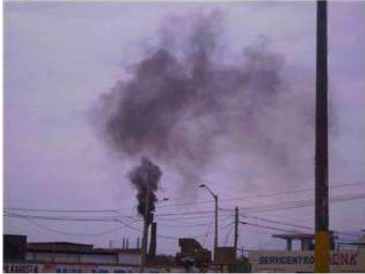
Figura 12: Emisiones industriales al aire en Chimbote.