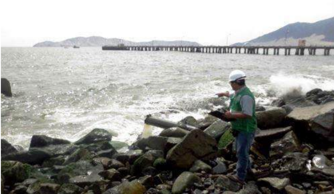
Figura 4: Emisiones de Aguas Servidas sin Tratamiento al Mar

En el cálculo de los indicadores se toma en cuenta el dato de población total de 365,534 habitantes para los distritos de Chimbote (206,213 hab.) y Nuevo Chimbote (159,321 hab.), utilizando la información del censo INEI del año 2017.