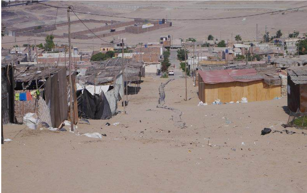
Figura 5: Asentamiento Humano por Invasiones