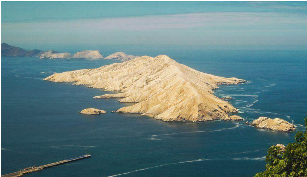
Figura 8: Isla Blanca Bahía de Chimbote

El Biólogo Rómulo Loayza Aguilar en su investigación: “Diagnostico del Humedal de Villa María” afirma que este ecosistema podría desaparecer, ya que más de 50ha de área natural han sido afectas. Este estudio tiene como origen el Rio Lacramarca, donde se puede percibir tuberías de expulsión de efluentes de las fábricas pesqueras. (Aguilar, 2002).