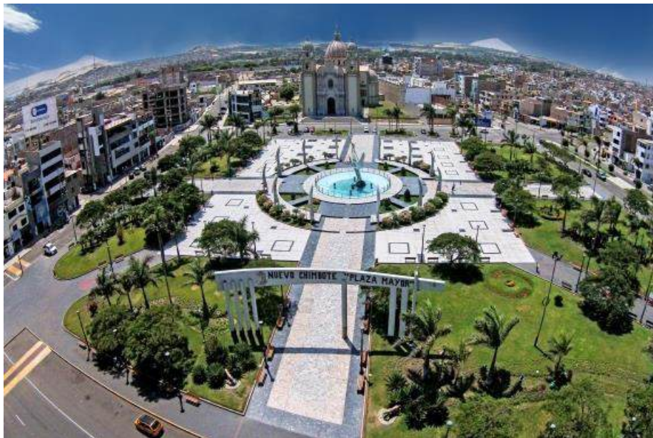
Figura 2: Plaza Mayor de Nuevo Chimbote