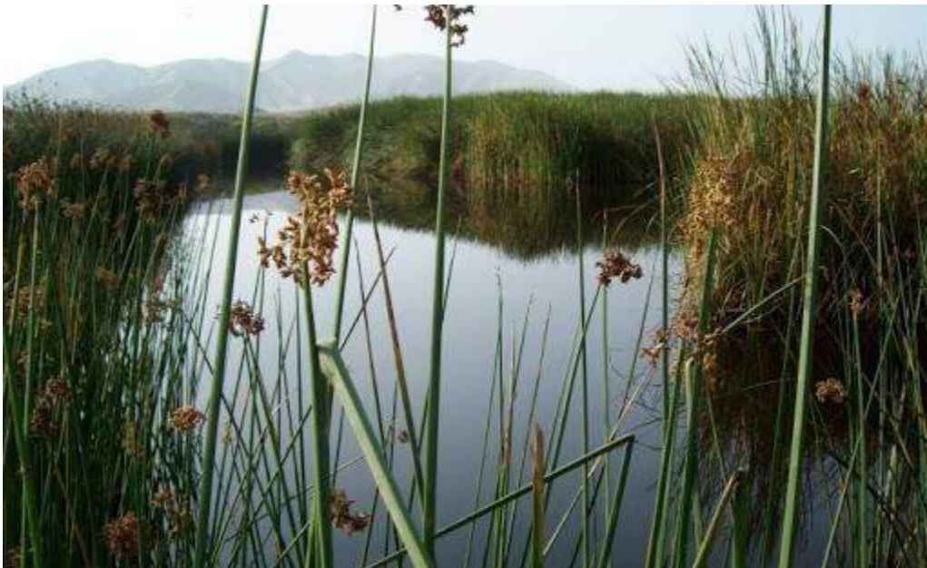
Figura 13: Humedales de Villa María

En marzo 2019 SERFOR (Servicio Nacional Forestal y de Fauna Silvestre), después de varias inspecciones, ha declarado el Humedal de Villa María como ecosistema frágil. Los ecosistemas frágiles son territorios de alto valor de conservación y son vulnerables a consecuencia de las actividades antrópicas que se desarrollan en ellos o en su entorno, que amenazan y ponen en riesgo los servicios ecosistémicos que brindan. Este representa un primer paso para su recuperación y para el reconocimiento como Área Natural Protegida, pero todavía hace falta mucho esfuerzo por parte de las autoridades para proteger y valorizar este ecosistema tan importante para la calidad de vida de las ciudades de Chimbote y Nuevo Chimbote, reconociendo y potenciando los servicios eco sistémicos que provee y articulándolos en los planes de desarrollo urbano de ambos distritos.