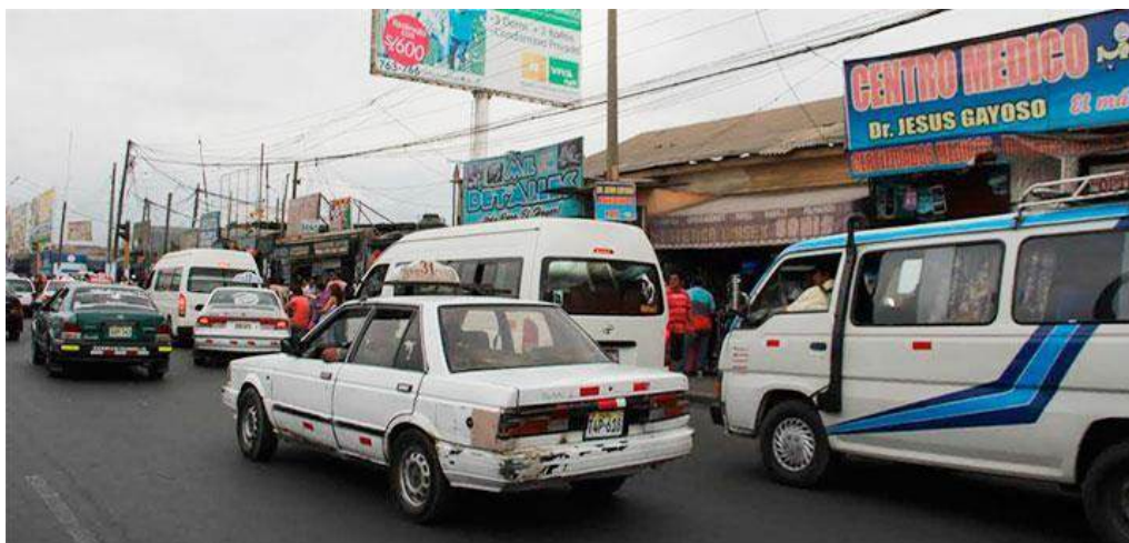
Figura 6: Situación del Transporte Público de Chimbote.

de la ciudad, siendo el eje costero el único que concentra las principales actividades de trabajo y servicios. Si a futuro se quisiera desarrollar nuevas áreas de centralidad urbana será necesario garantizar niveles óptimos de accesibilidad en la zona este de la ciudad.