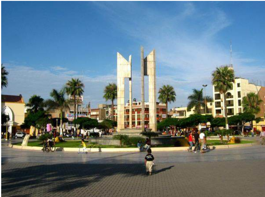
Figura 1: Plaza de Armas de Chimbote