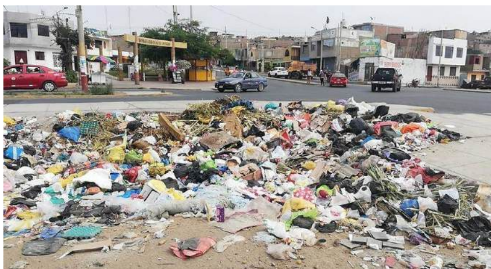
Figura 10: Acumulación de Desechos Sólidos en las calles de la Ciudad

Esto muestra que se están haciendo esfuerzos para mejorar el servicio de recolecta y gestión de residuos sólidos y se espera ver resultados en los próximos años.