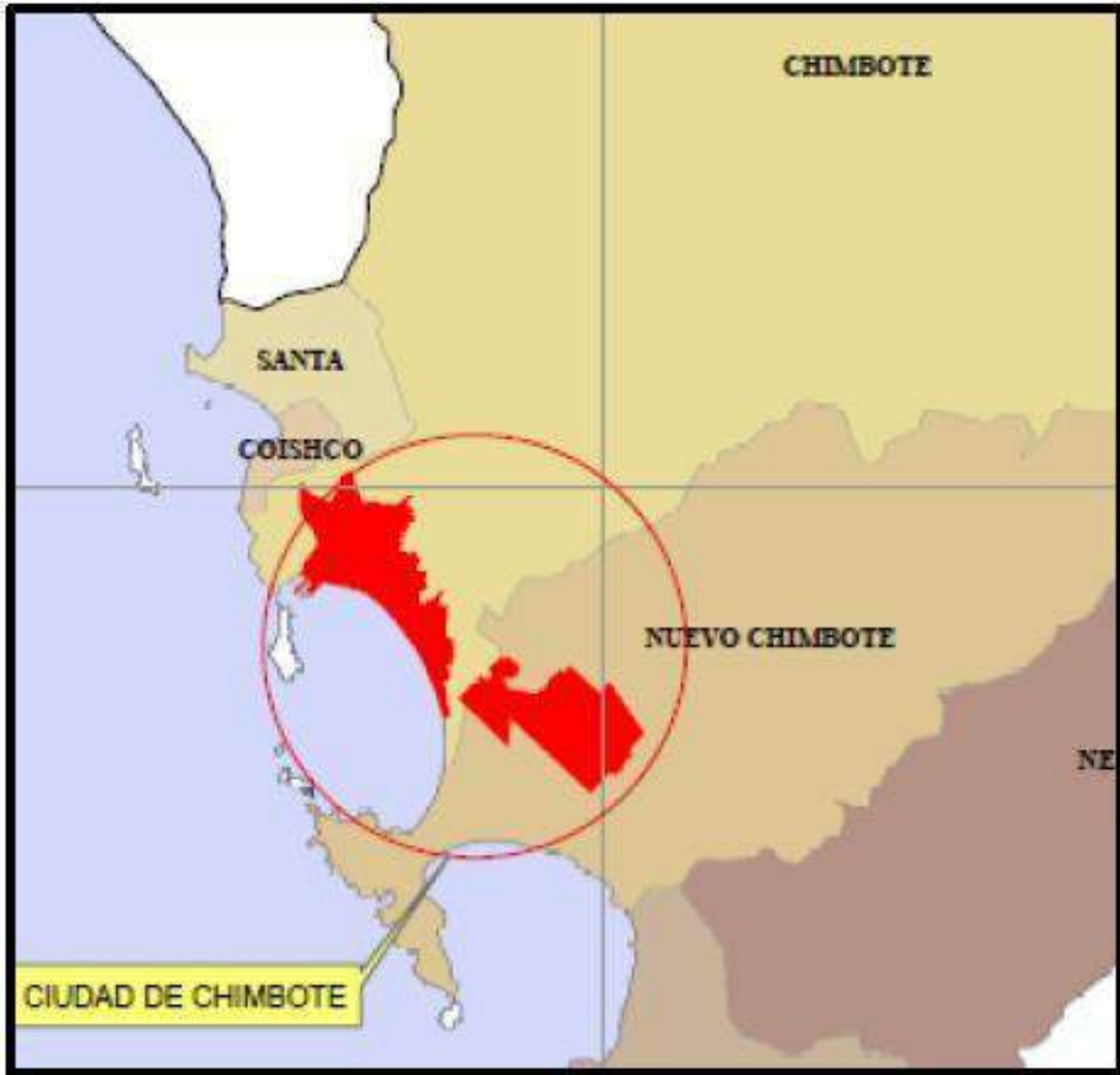
Figura 3: Mapa de Ubicación de Chimbote y Nuevo Chimbote