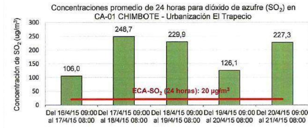
Figura 11: Emisiones en el Aire en Chimbote

Los siguientes gráficos muestran los niveles de SO 2 registrados por la OEFA del Ministerio del Ambiente en 2015.