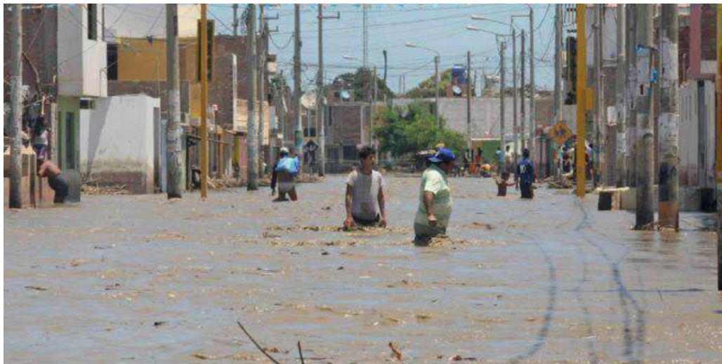
Figura 9: Inundaciones en Chimbote

Nota: En el cálculo del indicador (N DFA por cada 100,000 personas), se ha utilizado 345,500 personas como población total, dato promedio entre 2003-2017.