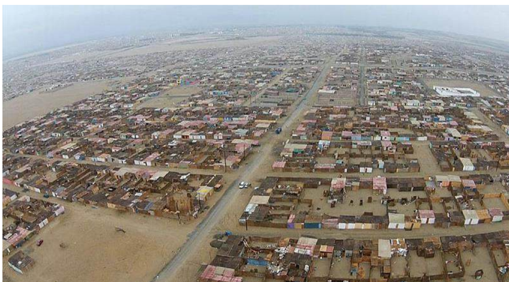
Figura 7: Vista Panorámica de Asentamientos Humanos

Dado este superávit de vivienda que existe en la actualidad en Chimbote, se plantea no disponer mayor suelo público para nuevos desarrollos inmobiliarios de vivienda. Las más de 500 hectáreas de suelo público invadidas en los últimos 10 años al sur de la ciudad constituyen un área que se ha formado con un fuerte interés especulativo, no teniendo ocupación efectiva muchos de sus lotes 19 . Debido a esto se requerirá de un gran esfuerzo público y privado para que estas áreas cuenten con condiciones mínimas de habitabilidad en los siguientes años. Dada la magnitud de este desafío, no tendría sentido aportar mayor suelo público para el desarrollo de nuevas viviendas en los siguientes 10 años, pues la expansión descontrolada de la ciudad afecta de manera crítica su sostenibilidad a futuro.